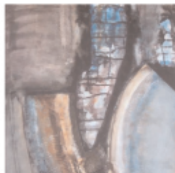
Elbeandebeneingebirge Ostsee, 1976.