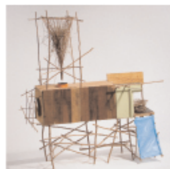
Fábrica de nidos, 2007.