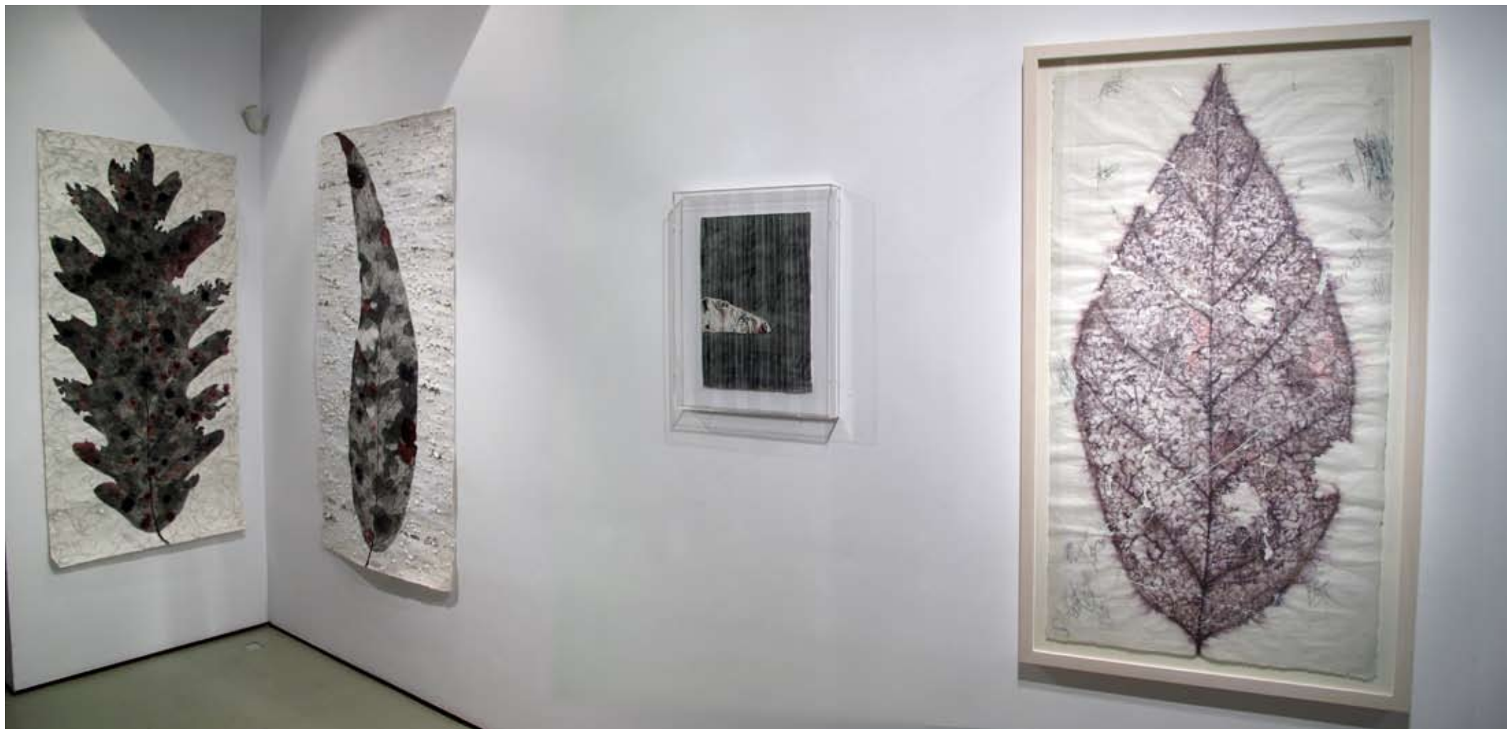
De la serie "Botanical Poems" y "Cartas" | Sala IV | Galería Astarté | 2011