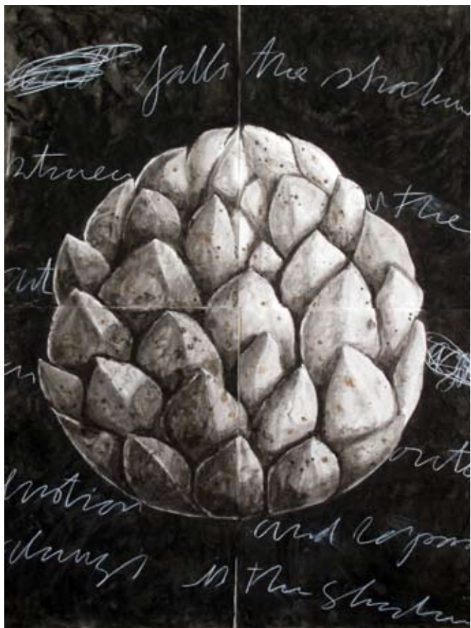
Pizarra | 175 x 127 cm | Técnica mixta sobre papel artesanal | 2011