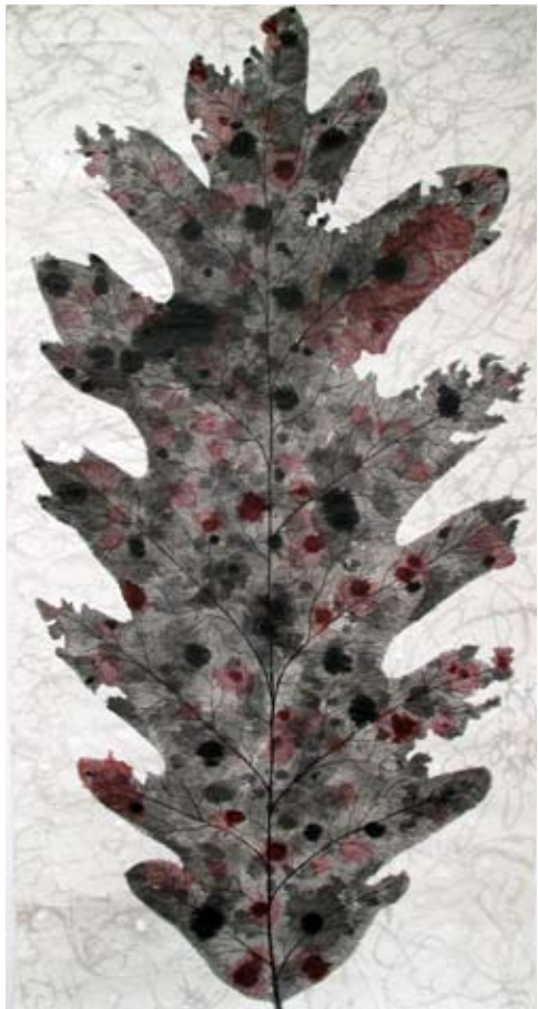
De la serie "Botanical Poems" | 180 x 90 cm | Técnica mixta sobre papel artesanal | 2010