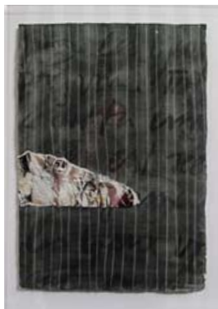
De la serie "Botanical Poems" | 180 x 90 cm | Técnica: mixta sobre papel artesanal | 2010