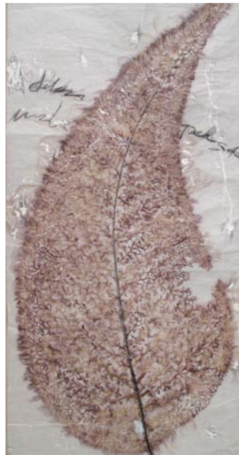
De la serie "Botanical Poems" | 163 x 94 cm | Técnica mixta sobre papel artesanal | 2010