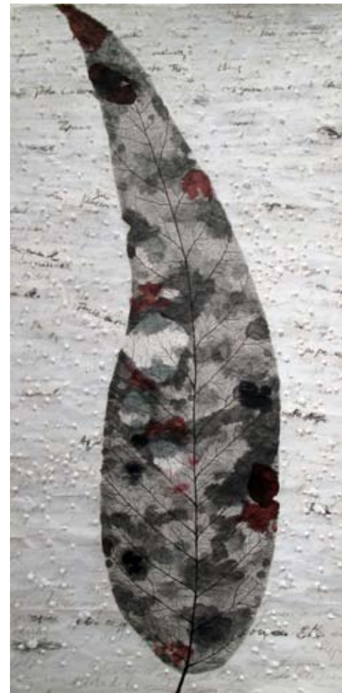
De la serie "Botanical Poems" | 180 x 90 cm | Técnica mixta sobre papel artesanal | 2010