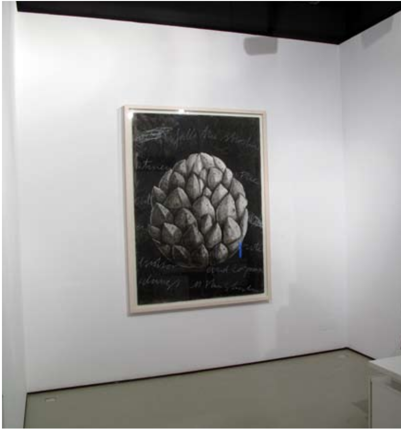
De la serie "Pizarras" | Sala II | 2011