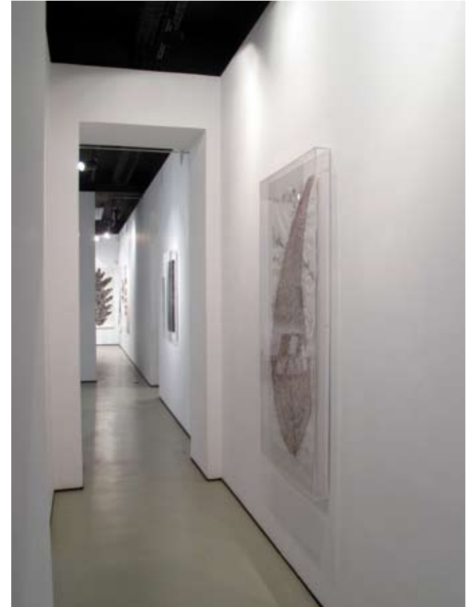
De la serie "Pizarras" y "Botanical Poems" | Pasillo I | 2011