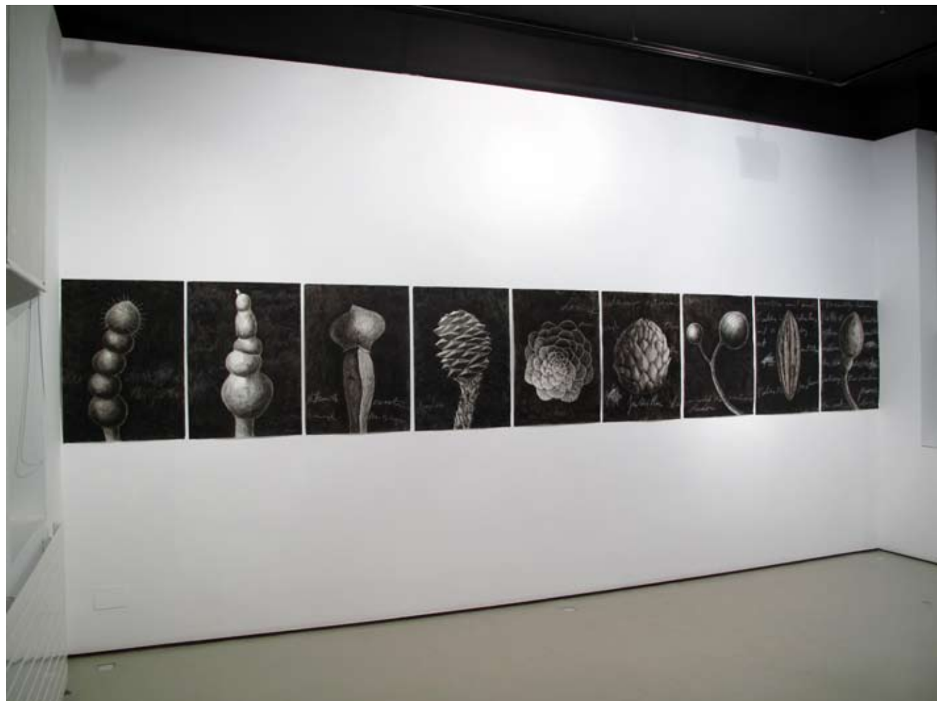
Serie "Pizarras" | Sala III, vista frontal | Galería Astarté | 2011