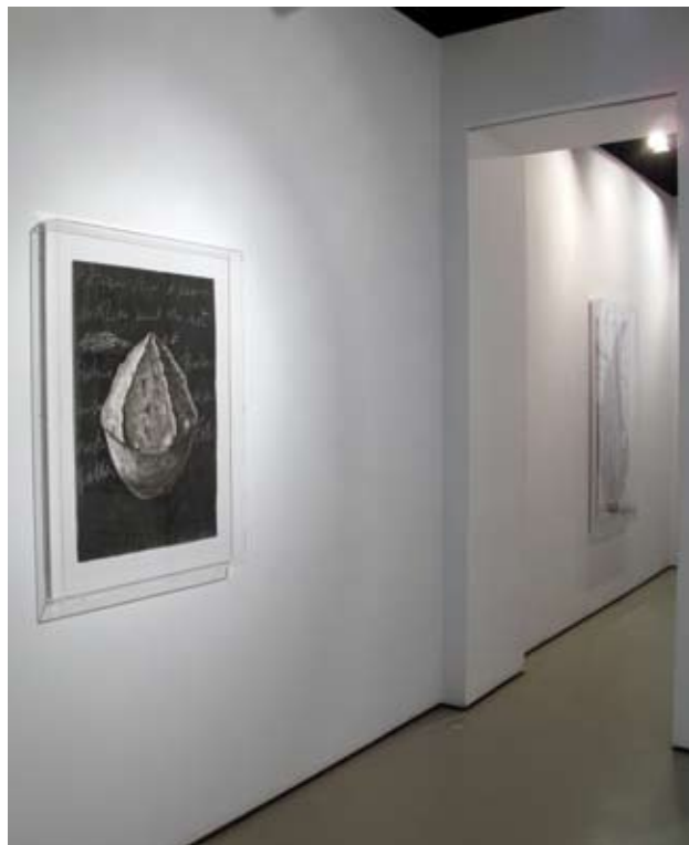
Serie "Pizarras" | Sala III, vista posterior | Galería Astarté | 2011