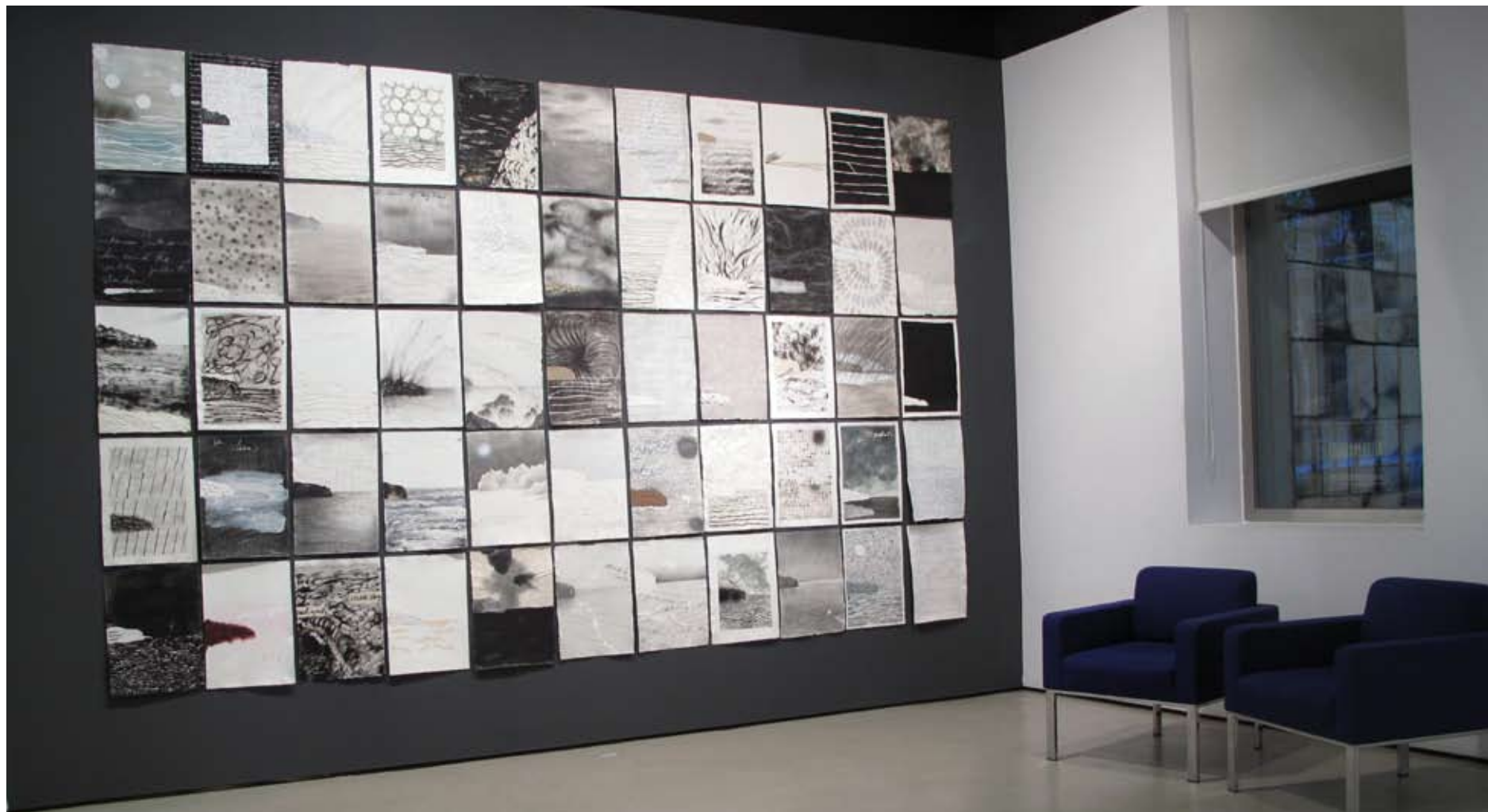
Serie "Cartas" | Sala I, vista posterior | Galería Astarté | 2011