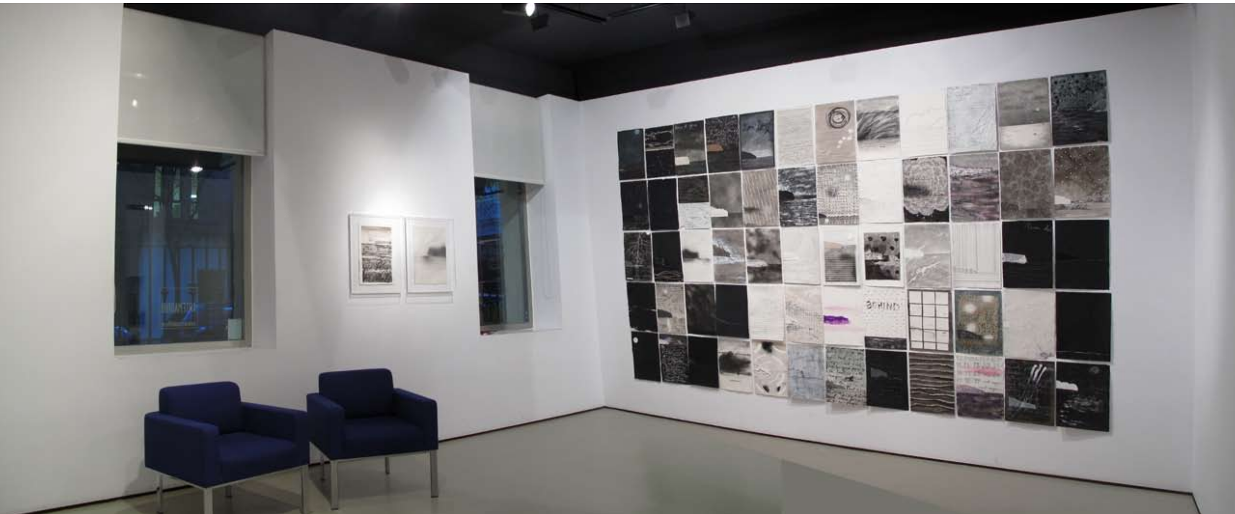
Serie "Cartas" | Sala I, vista frontal | Galería Astarté | 2011