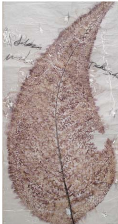
De la serie "Botanical Poems" | 163 x 94 cm | Técnica: mixta sobre papel artesanal | 2010