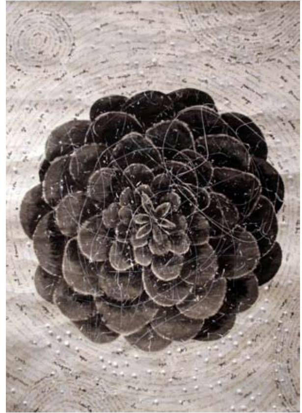
De la serie "Botanical Poems" | 125 x 89 cm | Técnica mixta sobre papel artesanal | 2010